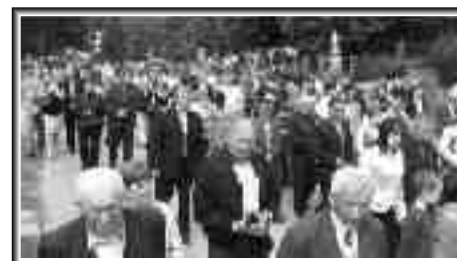
Procesje w Mszczonowie, Lutkówe i Osuchowie